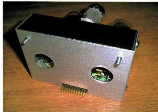
交換ユニット (底部)